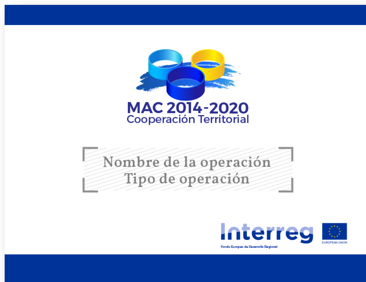
Ejemplo de Cartel Permanente.

El cartel o la placa indicarán el nombre de la operación, el principal objetivo de ésta y los dos logotipos de uso obligatorio en el marco del programa INTERREG MAC 2014-2020 (el logotipo del Programa y el logotipo europeo integrado). Dichos elementos deben ocupar al menos el 25 % del cartel o placa.