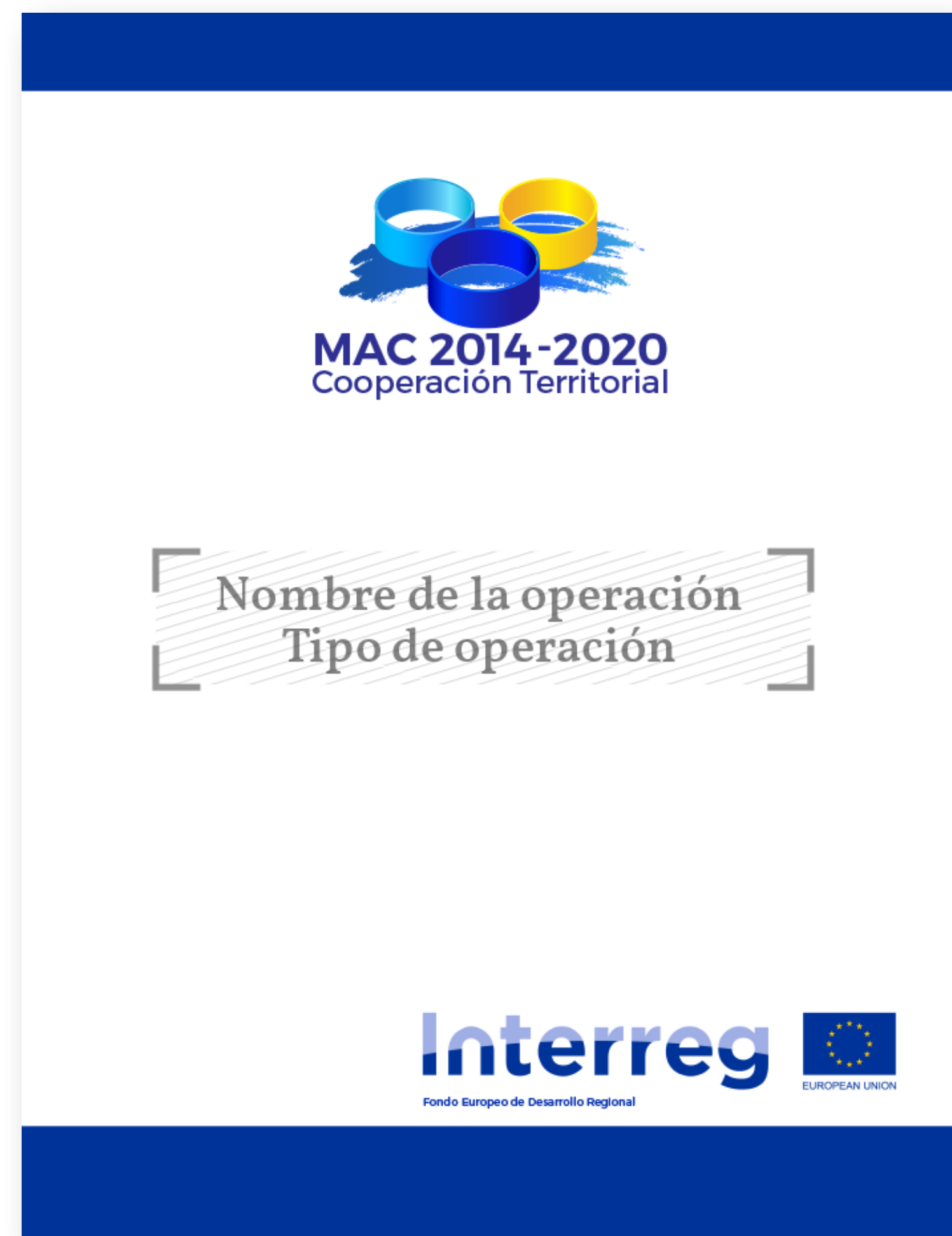
Ejemplo de Cartel Temporal.

El cartel deberá estar situado en un lugar bien visible para el público, por ejemplo en el vestíbulo de entrada de un edificio u oficina.