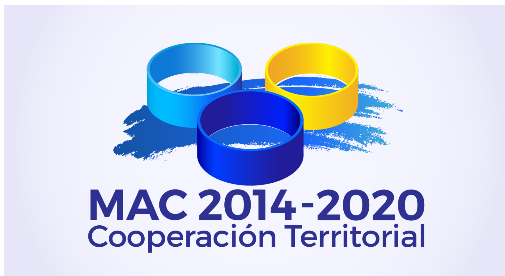
El logotipo del Programa de Cooperación Territorial MAC 2014 - 2020 en su forma vertical.

La coherencia entre los colores del logotipo y los del fondo debe mantenerse siempre para preservar la imagen distintiva del logotipo.