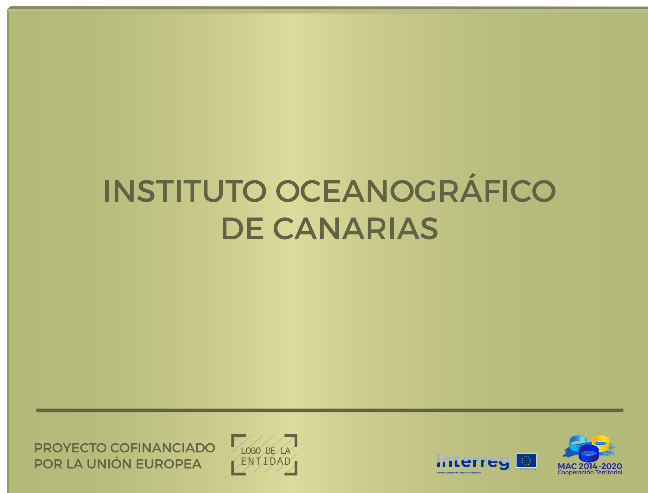
Ejemplo de Placa Fija para un Centro de Investigación

Dichos elementos deben ocupar al menos el 25 % del tamaño total del cartel.