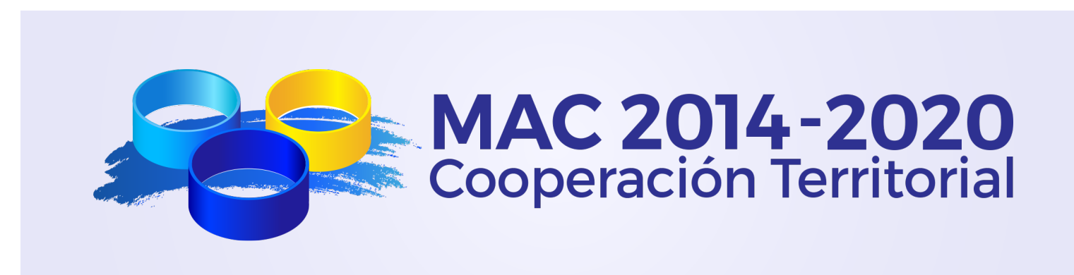
El logotipo del Programa de Cooperación Territorial MAC 2014 - 2020 en su forma apaisada.